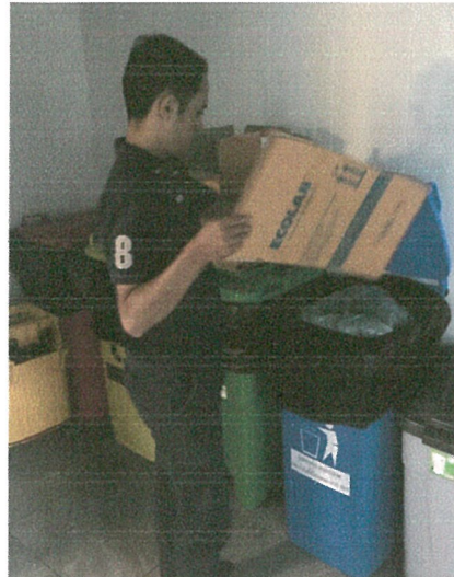
รูปภาพที่ 2.26 การทำความสะอาดห้องพักรวมและถังขยะ