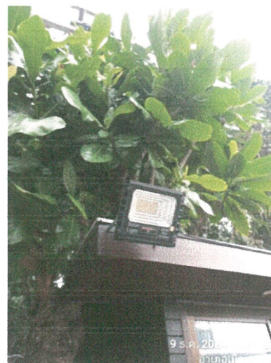
รูปภาพที่ 2.12 ไฟฟ้าส่องสว่างทางเข้า-ออกโครงการ