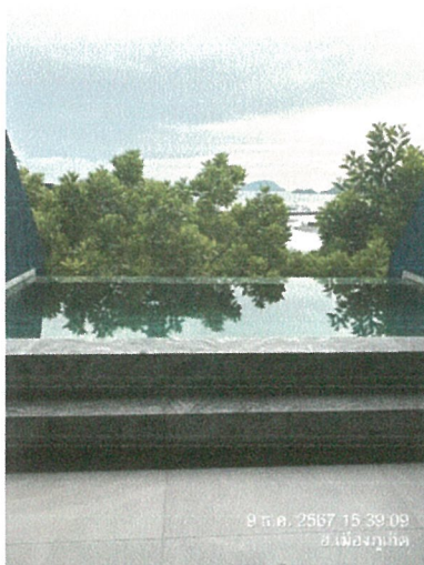
รูปภาพที่ 2.40 สระว่ายน้ำของโครงการ