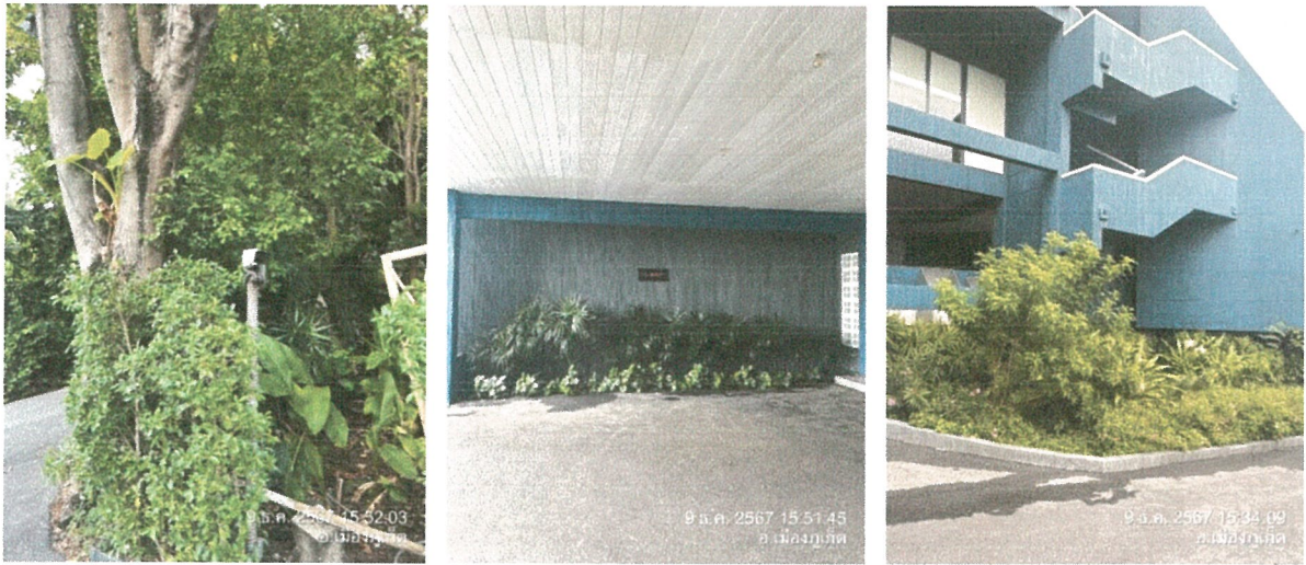
รูปภาพที่ 2.1 พื้นที่สีเขียว