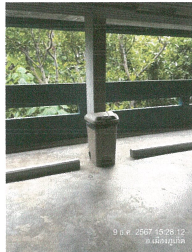
รูปภาพที่ 2.23 ถังขยะบริเวณพื้นที่ส่วนกลาง