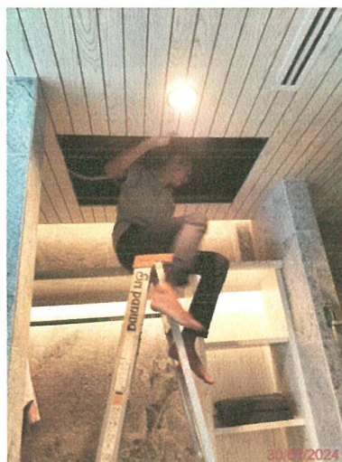
รูปภาพที่ 2.42 การตรวจสอบอุปกรณ์ไฟฟ้าส่องสว่าง