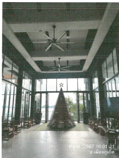
รูปภาพที่ 2.4 ร้านอาหาร