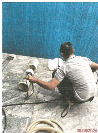
รูปภาพที่ 2.32 การทำความสะอาดเครื่องปรับอากาศ