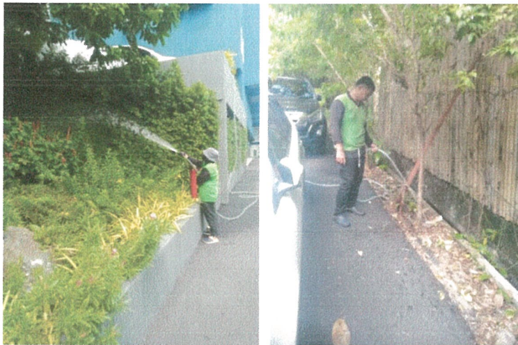
รูปภาพที่ 2.2 คนสวน