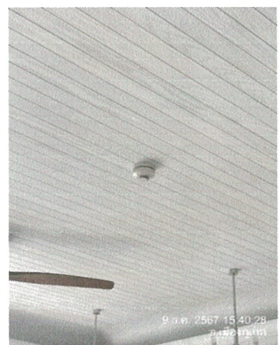
อุปกรณ์ตรวจจับควัน