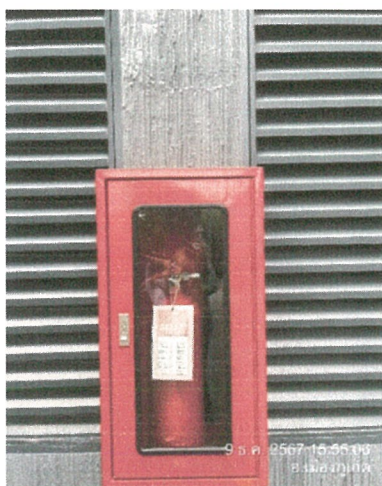
ถังดับเพลิง