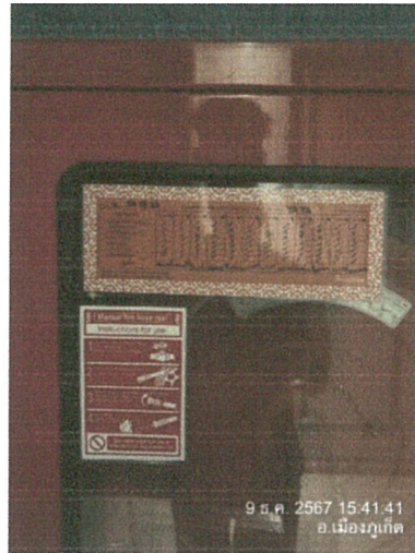
รูปภาพที่ 2.34 ป้ายแสดงวิธีการอุปกรณ์แจ้งเตือนด้วยมือ