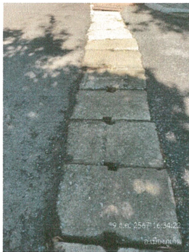
รูปภาพที่ 2.18 วางระบายน้ำ