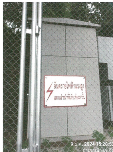
รูปภาพที่ 2.28 ป้ายหรือสัญลักษณ์เตือนให้ระวังอันตรายจากไฟฟ้า