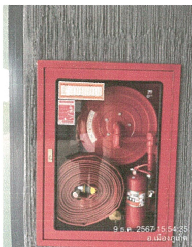
ตู้อุปกรณ์ดับเพลิง