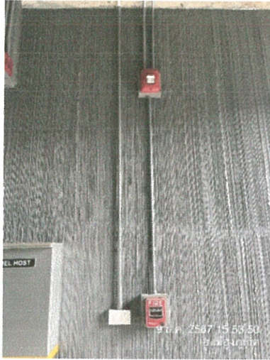
อุปกรณ์แจ้งเตือนแบบเสียงและแสง