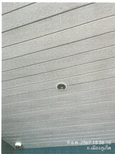
รูปภาพที่ 2.29 อุปกรณ์ไฟฟ้าส่องสว่างแบบประหยัดพลังงาน