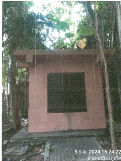
รูปภาพที่ 2.21 ห้องพักขยะ