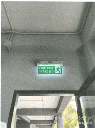
รูปภาพที่ 2.35 ป้ายทางหนีไฟ