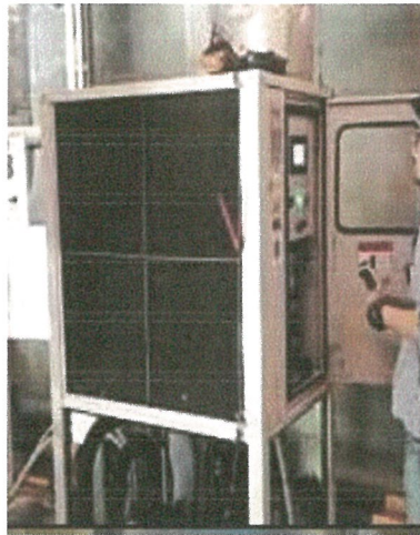
รูปภาพที่ 2.31 การซ่อมบำรุงอุปกรณ์ระบบไฟฟ้าส่วนกลาง