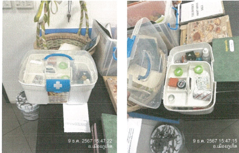
รูปภาพที่ 2.39 อุปกรณ์ปฐมพยาบาล