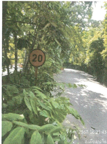
รูปภาพที่ 2.8 ป้ายจำกัดความเร็วไม่เกิน 20 กม./ชม.