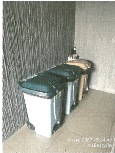
รูปภาพที่ 2.22 ถังขยะแยกประเภท