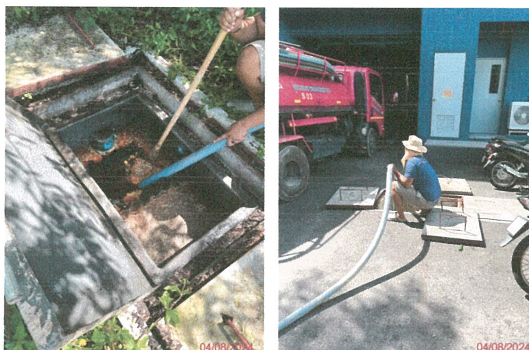
รูปภาพที่ 2.44 การสูบละกอน