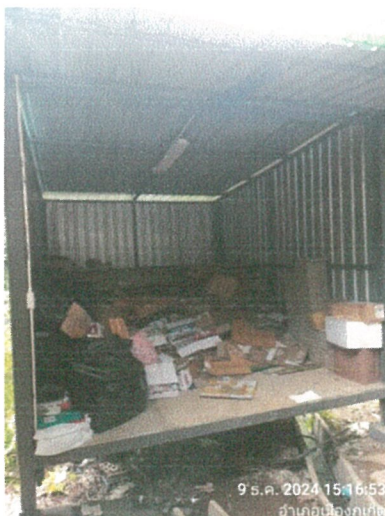
รูปภาพที่ 2.24 โรงคัดแยกขยะ