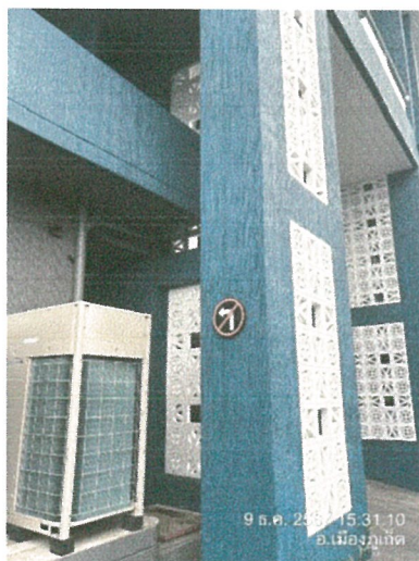
รูปภาพที่ 2.11 ป้ายสัญลักษณ์ทางจราจร