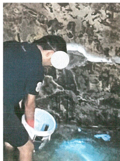
รูปภาพที่ 2.16 การล้างทำความสะอาดถังเก็บน้ำใช้