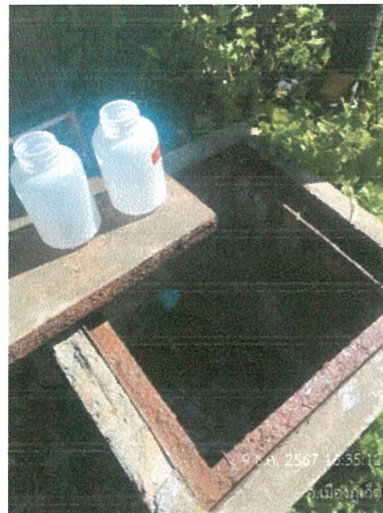
รูปภาพที่ 2.14 บ่อน้ำและบ่อพักน้ำ