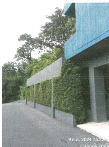
รูปภาพที่ 2.6 โครงสร้างของอาคาร