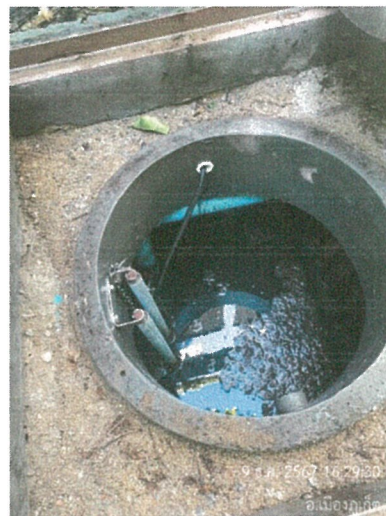
รูปภาพที่ 2.19 ระบบบำบัดน้ำเสีย