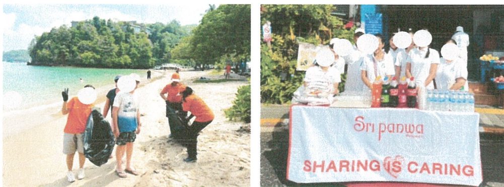
รูปภาพที่ 2.3 การร่วมกิจกรรมกับชุมชน