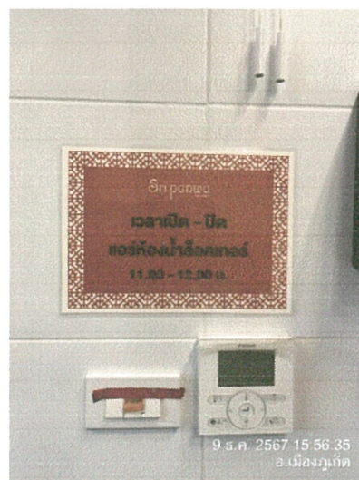
รูปภาพที่ 2.30 ป้ายประหยัดพลังงาน