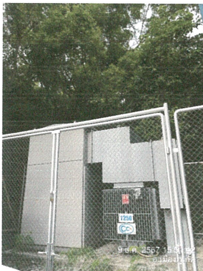
รูปภาพที่ 2.27 หม้อแปลงไฟฟ้า