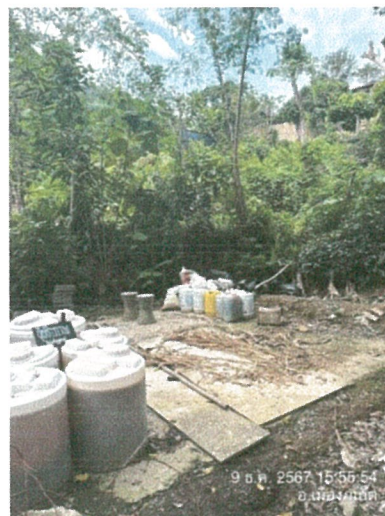
รูปภาพที่ 2.25 จุดทำปุ๋ยหมักชีวภาพของโรงแรม