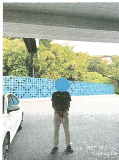
รูปภาพที่ 2.5 เจ้าหน้าที่รักษาความปลอดภัย