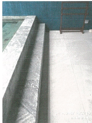
รูปภาพที่ 2.41 รางระบายน้ำ