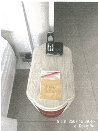
รูปภาพที่ 2.37 โทรศัพท์ติดต่อภายในห้องพัก