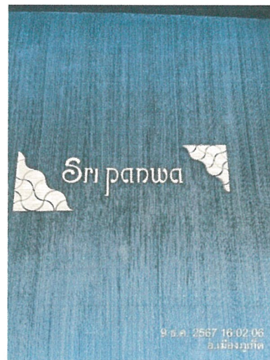
รูปภาพที่ 2.10 ป้ายโครงการ