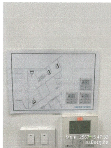
รูปภาพที่ 2.36 ป้ายเส้นทางอพยพหนีภัย