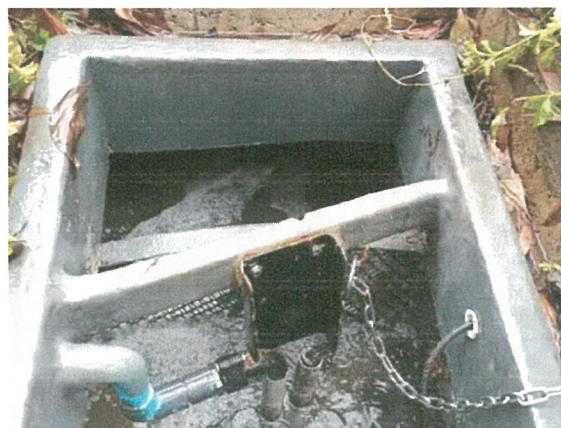
รูปภาพที่ 2.20 การตรวจเช็คระบบบำบัดน้ำเสีย