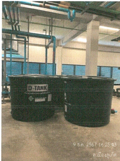
รูปภาพที่ 2.13 ถังเก็บน้ำใช้