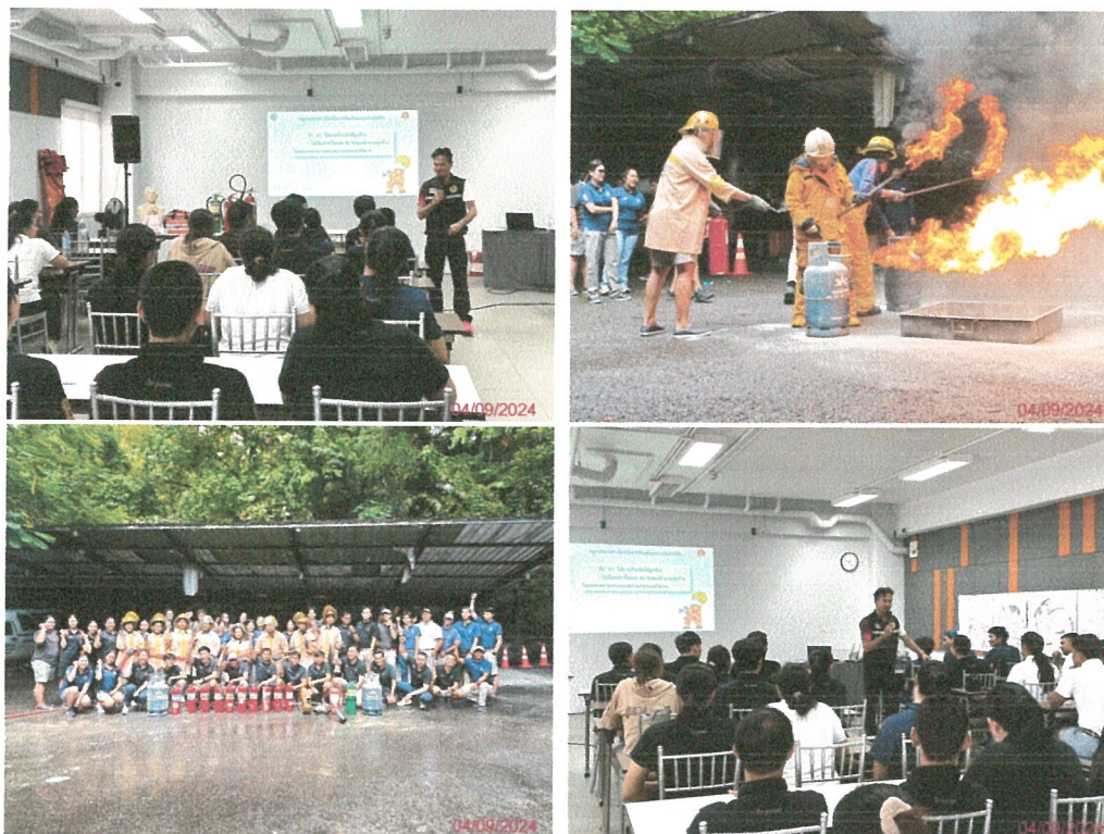
รูปภาพที่ 2.43 การซ้อมอพยพหนีไฟ