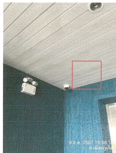
รูปภาพที่ 2.38 ระบบโทรทัศน์วงจรปิด (CCTV)