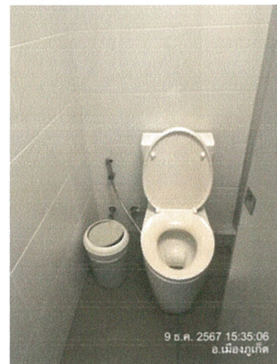
รูปภาพที่ 2.15 สุขภัณฑ์ที่ประหยัดน้ำ