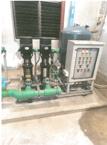
รูปภาพที่ 2.17 การตรวจเช็คเส้นท่อของระบบการจ่ายน้ำ